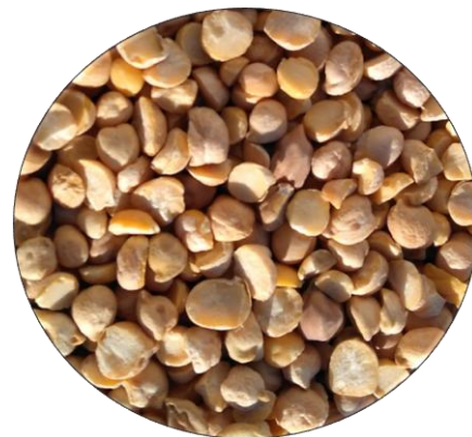
FOTO GARBANZO PARTIDO ECO