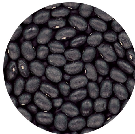
FOTO FRIJOL NEGRO ECO