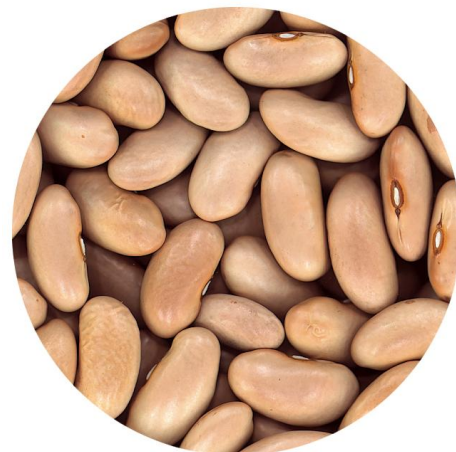
FOTO ALUBIA CANELA